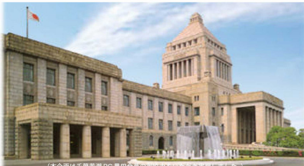
(本企画は千葉若潮RC 里田会員の御協力をいただき実現しました。)